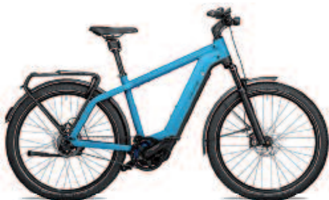
RIESE MÜLLER, DE ALLESKUNNER IS MET FLYER 1 VAN ONZE ONZE TOPMERKEN!