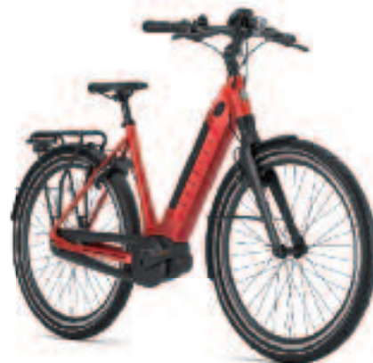
GAZELLE ULTIMATE BOSCH ACTIVE LINE+ 500W 3299,-