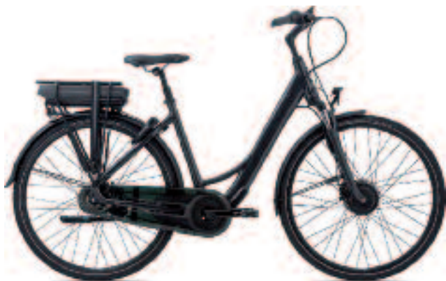
GIANT EAS-1 VANAF 1699,- KRACHTIGE VOORWIELMOTOR

MAAK NU EEN AFSPRAAK VOOR EEN TESTRIT! EN FIETS DE ZOMER IN!