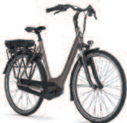
GAZELLE PARIS BOSCH ACTIVE 1999,-