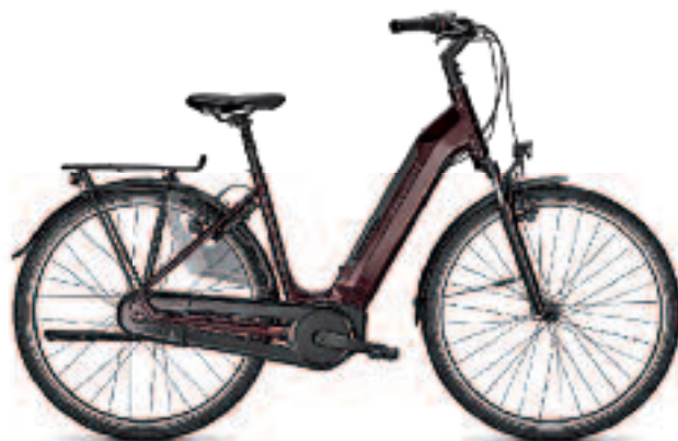
KALKHOFF AGGATU 3.B BOSCH ACTIVE LINE+ 2799,-