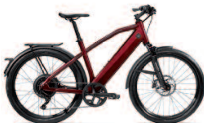
STROMER ST1 HIGH-SPEED-BIKE 45KM/H. DE NUMMER 1 FORENSEN-FIETS V.A. 3999,-