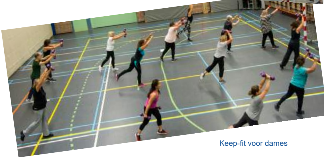
Keep-fit voor dames