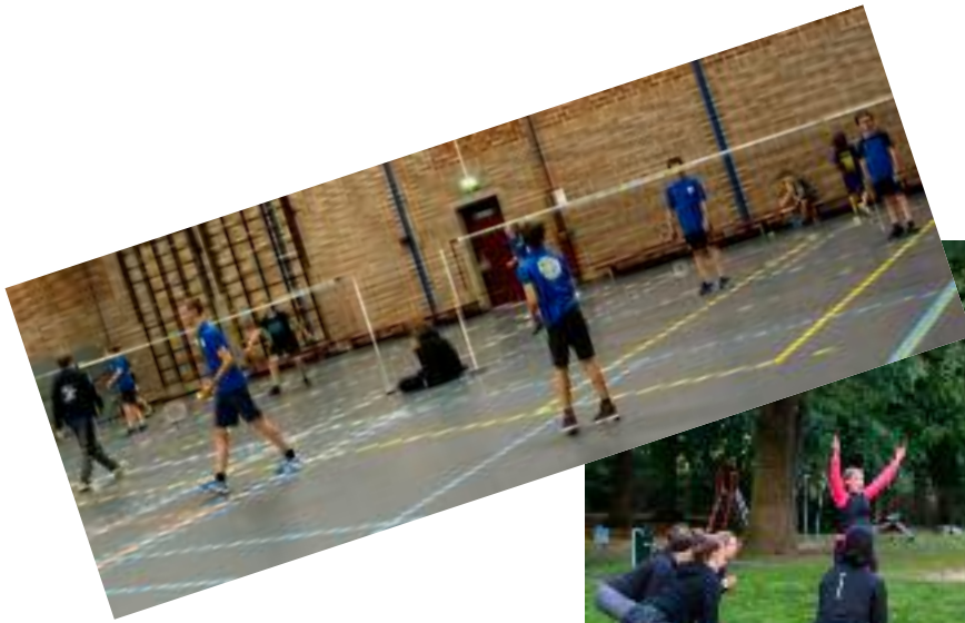
Badminton voor jong en oud op donderdagavond

Bootcamp op woensdagavond door de hele wijk, hier in de speeltuin