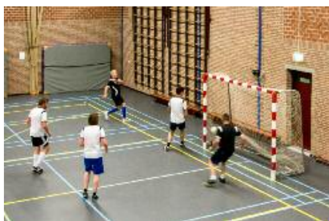
zaalvoetbal voor heren