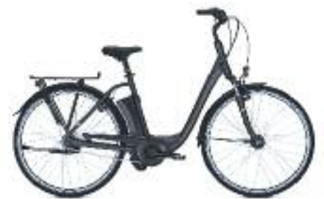
KALKHOF AGATTU MIDDENMOTOR 400 WH LAGE INSTAP NU 1999.-