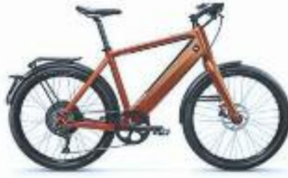
STROMER HIGHSPPEED 45 KM/H ACCU 1000WH VOOR AFSTAND 60-150 KM VAN 5990.- VOOR 5250.-