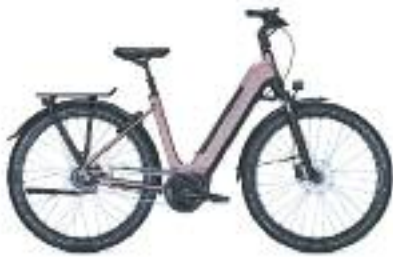
KALKHOF IMAGE MOVE MIDDENMOTOR 500 WH DIV. KLEUREN. GEINTEGREERDE ACCU, VAN 2999.- NU 2649.-