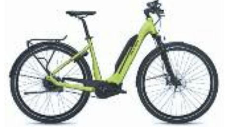
FLYER UPSTREET 5-7.30 ONS TOPMODEL, MET RIEM EN KRACHTIGE PANASONIC MOTOR 630WH 3899.- VOOR 3499.-