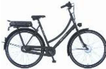
CORTINA U1, ELEKTRISCHE STADSFiets VOOR NAAR SCHOOL EN WERK VANAF 1259.-