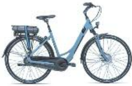
GIANT EAS 2 MET 400WH VAN 1799.- NU 1649.-